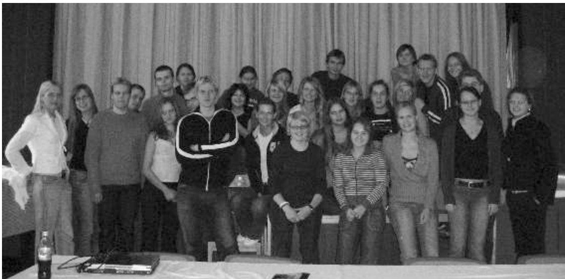
Tapaamisen iloinen osanottajajoukkio.

vaikutuksia väestöön ja perheisiin. Viikonlopun aikana keskusteltiin myös yhteisistä projekteista ja yhteistyön edistämisestä maiden välillä.